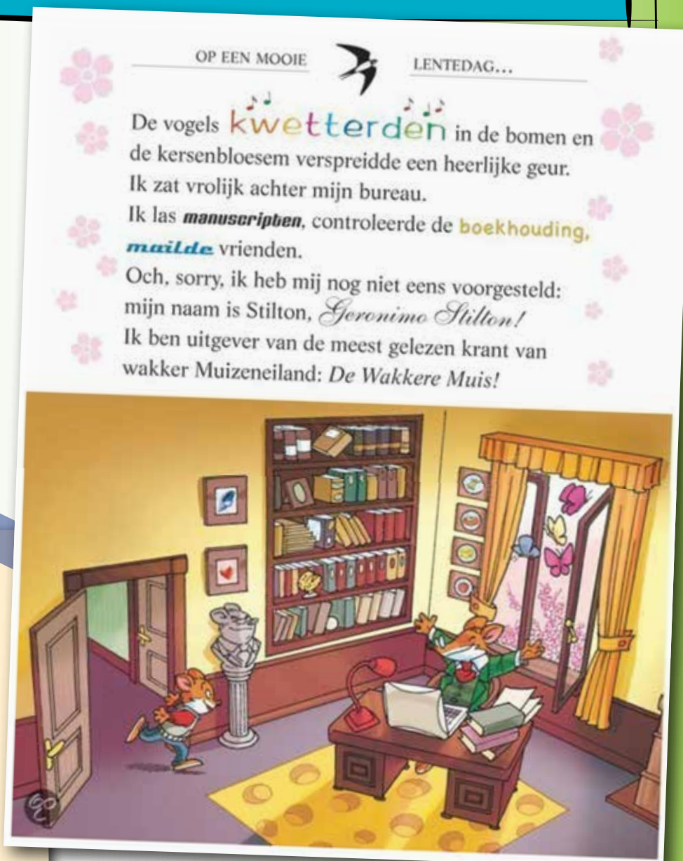
Fragment uit: Fantasia III Geronimo Stilton, De Wakkere Muis, 2015

2 Bekijk 'kwetterden'. Het is eigenlijk niet geschreven maar getekend. Waarom is het zo getekend? Leg uit.