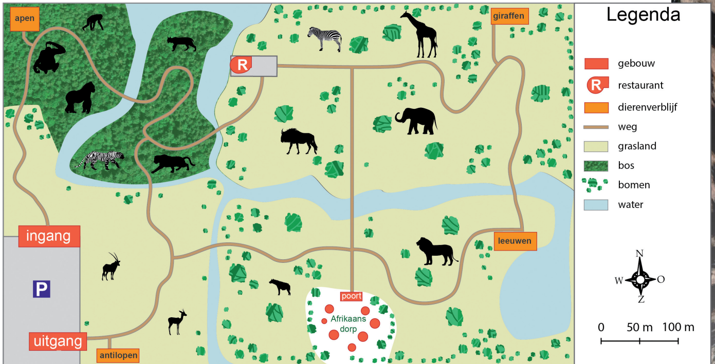
Kaart 1. Plattegrond safaripark Rivierdalen

Gebruik voor de volgende opgaven de plattegrond en een liniaal.